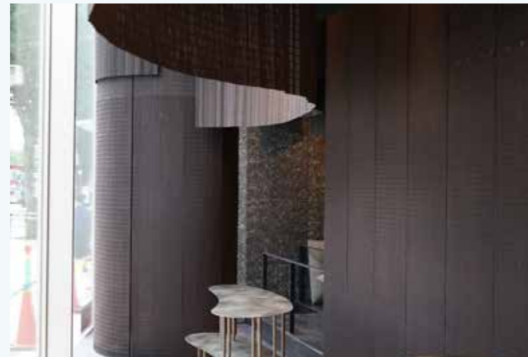
Texture noire au café kuriya otona kurogi, PARCO ya Ueno, Tokyo, Japon. Architecte : Kengo Kuma & Associates.

Trois produits sont commercialisés par la maison Shikada : Manyo et Shikisai (stores intérieurs), et Shikada Woven (matière première). Le premier, le plus luxueux, est réalisé à la main, en un temps résolument long, dans les règles d'un savoir-faire authentique vieux de mille ans. Il matérialise l'art subtil de diviser une pièce, le kekkai, qui fait coexister les notions de délimitation et d'unité spatiale : une forme de frontière de politesse, observée avec finesse et attention. Translucide, le tissage divise ainsi des espaces contigus sans réellement les désunir. La gamme Manyo se décline en neuf textures délicates réalisées selon la technique du fushi-zoroé. Celle-ci consiste à conserver les nœuds du bambou en tirant parti de ces irrégularités pour créer des motifs ordonnés tout en relief. Avec un diamètre minimal de 1,4 mm, le résultat obtenu est particulièrement fin. Les baguettes, de profil rond ou ovale, sont insérées une à une dans le métier à tisser manuel, ce qui permet d'opérer un décalage subtil au fur et à mesure de l'assemblage, avant l'étape finale du tressage.